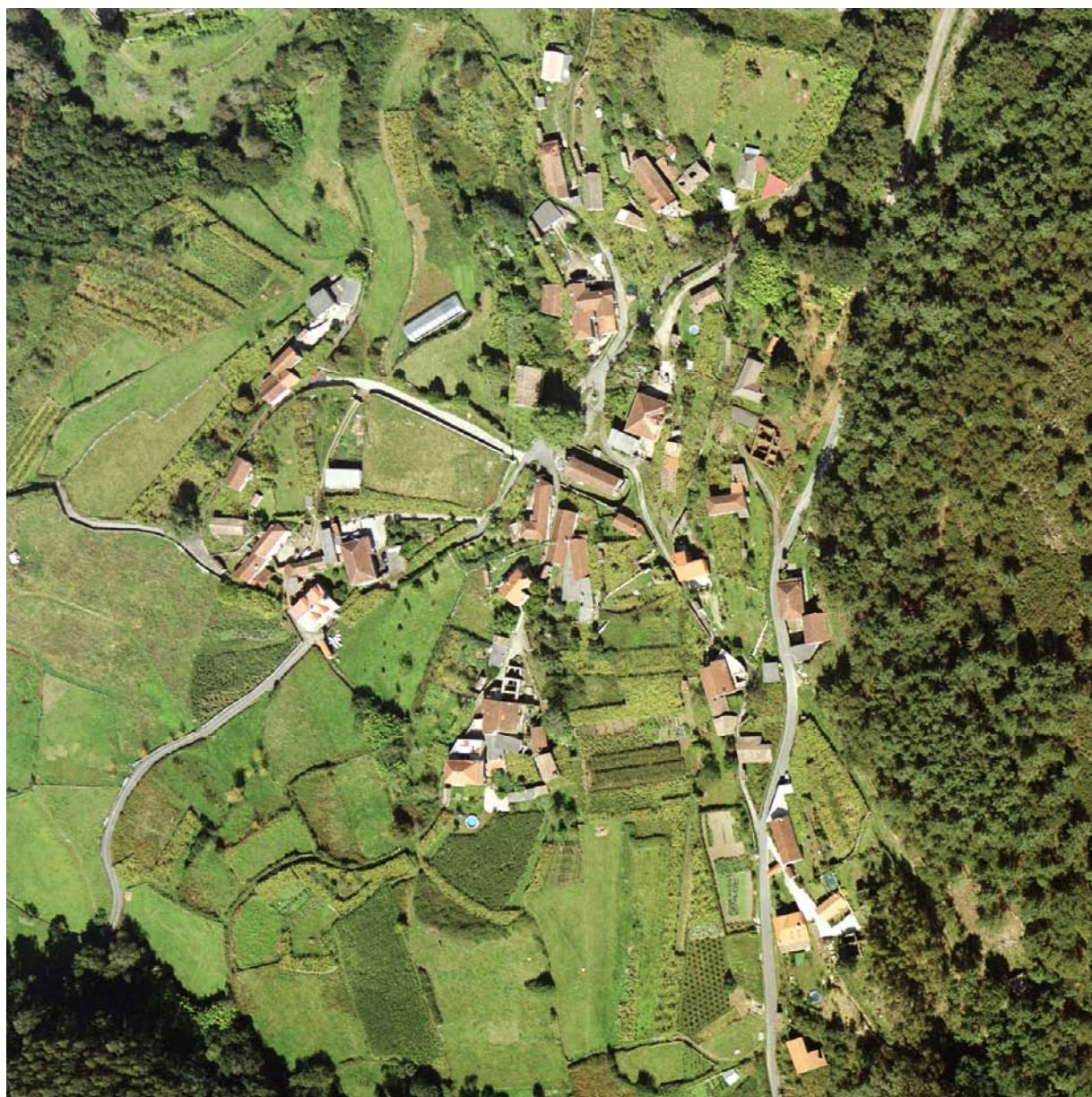
Fotografía aérea de Cosoirado.